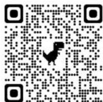
What is a Question