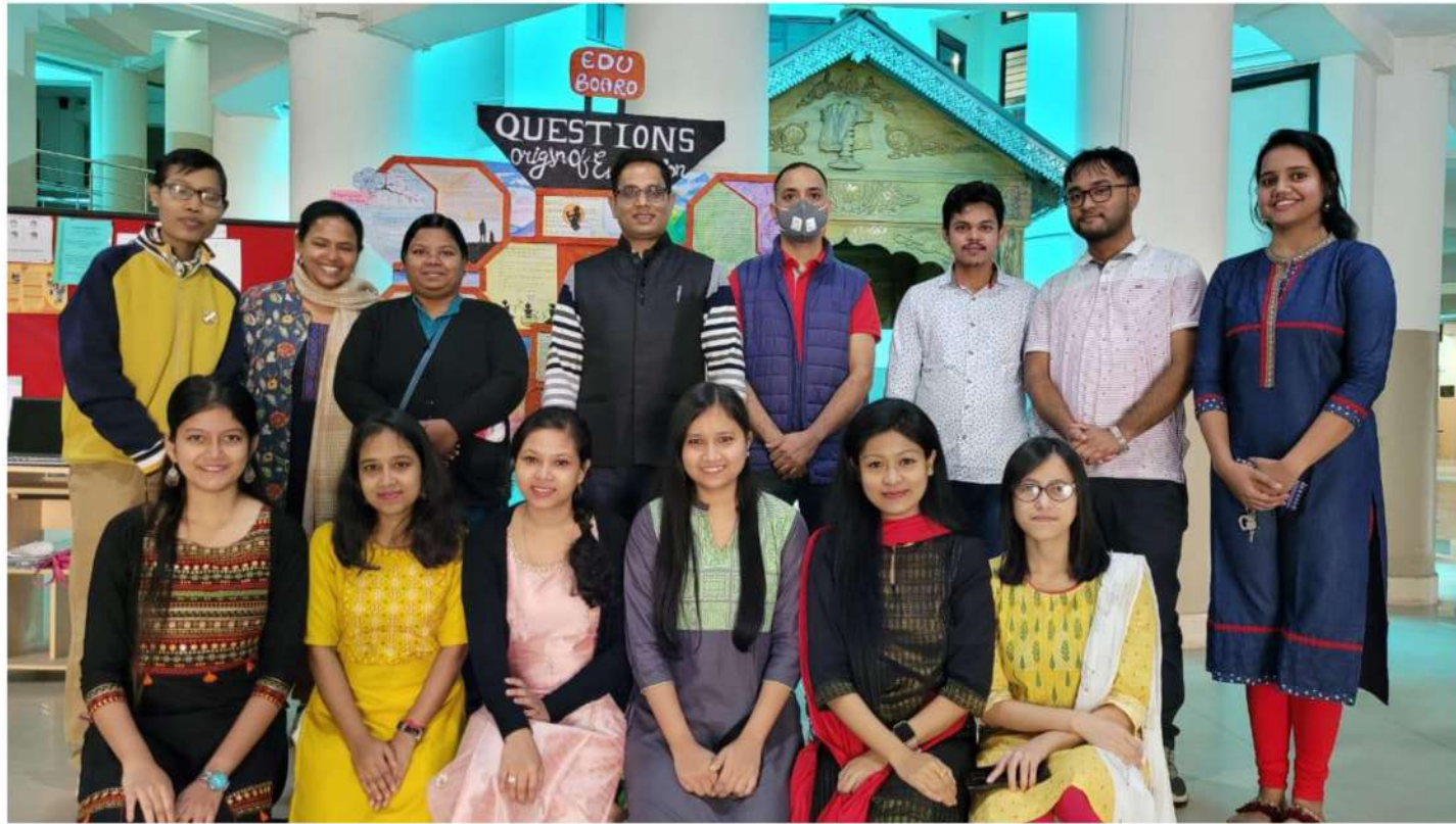
Team Members along with the faculties of Dept. of Education