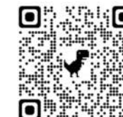
Letter to the Editor