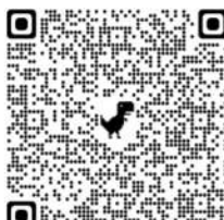
Ami gonit kio hikibo lage