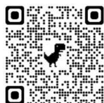
A Tale of Pandemic