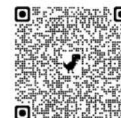
Kukhole thokar o aa