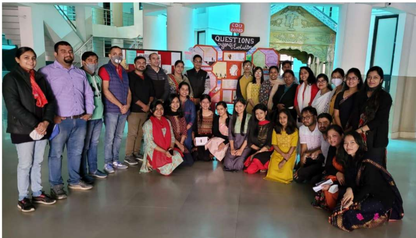
Faculties and, Students of B.Ed. Third Semester, Department of Education Tezpur University, Session – 2020-22